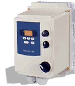
Frekvensomriktare IP65 MD201F ... 210F/IP65 MD402F ... 405F/IP65 CE c UL UL